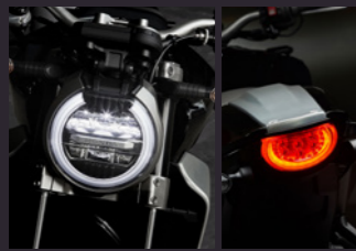
All LED Lights