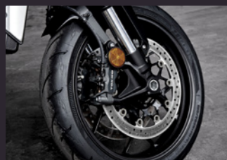
Tokico 고성능 브레이크 & ABS