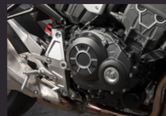
어시스트 슬리퍼 클러치