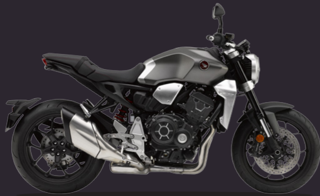
Mat Bullet Silver