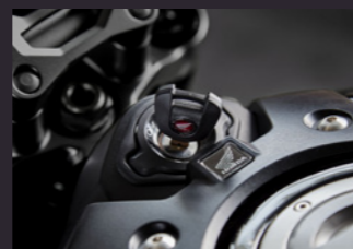
Wave Key & H.I.S.S