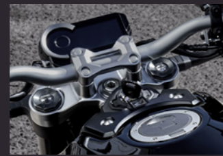
Showa SFF-BP 도립식 포크