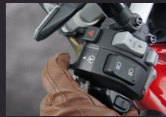
HSTC (혼다 셀렉터블 토크 컨트롤)