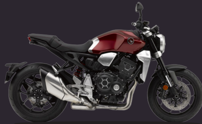
Candy Chromosphere Red