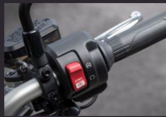
전자식 스로틀 (Throttle By Wire)