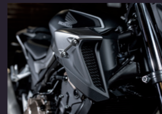
대형 흡기 덕트 & 슈라우드