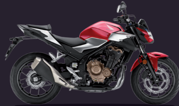
Grand Prix Red / Mat Cripton Silver Metallic