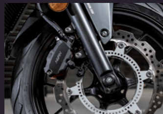
최신 모듈레이터 ABS