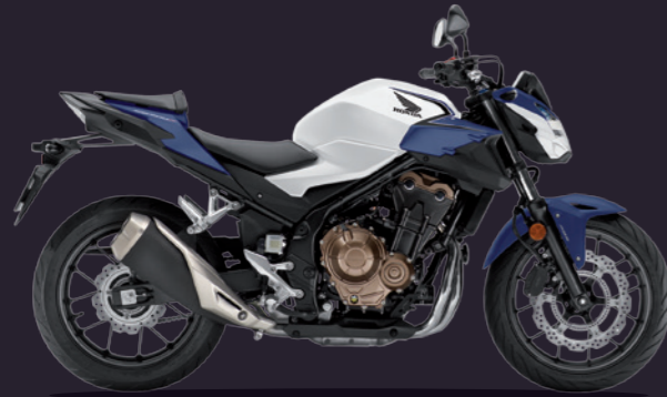
Pearl Metalloid White / Mat Pearl Agile Blue