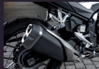
이중 테일파이프 머플러