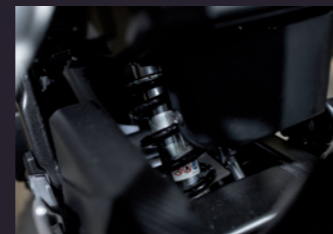
분리 가압식 싱글 튜브 서스펜션