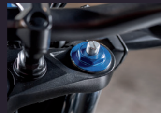
조절식 프론트 포크