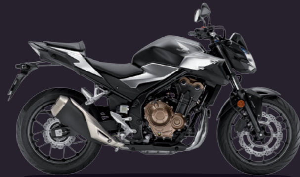
Mat Gunpowder Black Metallic / Mat Cripton Silver Metallic