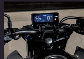
풀 디지털 계기판 & 테이퍼 핸들