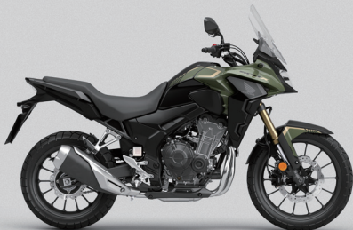
Pearl Organic Green - 그린