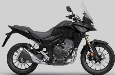
Mat Gunpowder Black Metallic - 매트 블랙