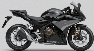
Mat Gunpowder Black Metallic - 매트 블랙