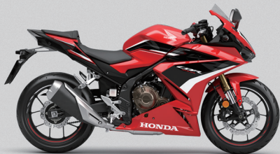
Grand Prix Red - 레드