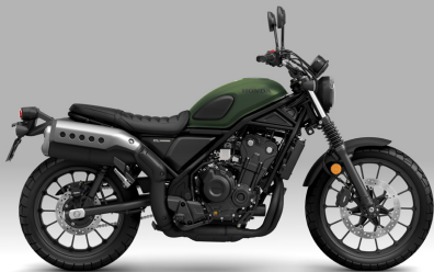
Mat Laurel Green Metallic - 매트 그린