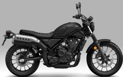
Mat Gunpowder Black Metallic - 매트 블랙