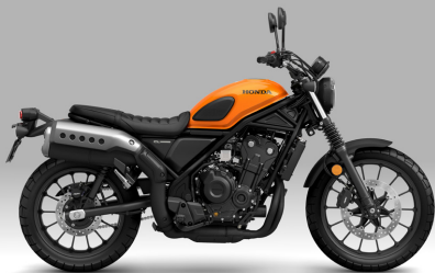
Candy Energy Orange - 오렌지