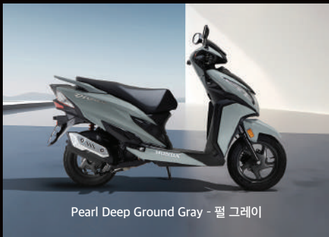
Pearl Deep Ground Gray - 펄 그레이