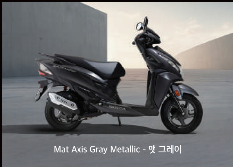
Mat Axis Gray Metallic - 매트 그레이