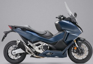
Mat Jeans Blue Metallic - 매트 블루