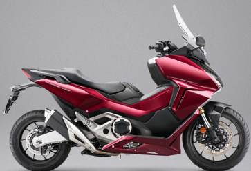
Candy Chromosphere Red - 레드