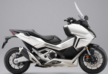
Mat Beta Silver Metallic - 매트 실버