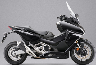
Graphite Black - 블랙