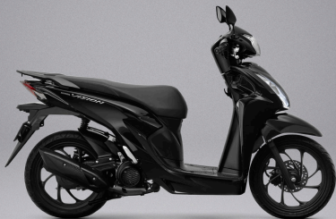
Poseidon Black Metallic - 블랙