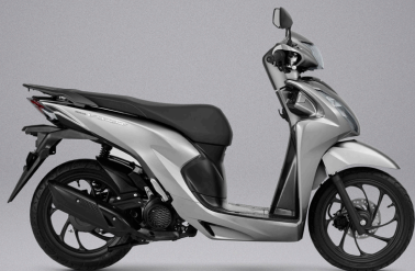
Decent Silver Metallic - 실버