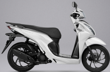
Pearl Jasmine White - 화이트