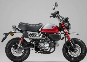
Pearl Nebula Red - 레드