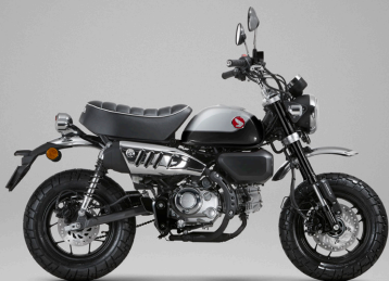
Pearl Shining Black - 블랙