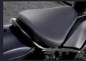
690mm로 낮은 높이의 편안한 시트