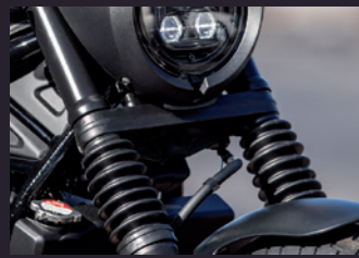
뛰어난 승차감의 프론트 포크