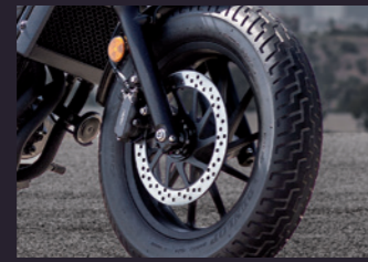
터프한 디자인의 ABS 기본장착 휠