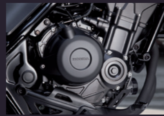
어시스트 슬리퍼 클러치