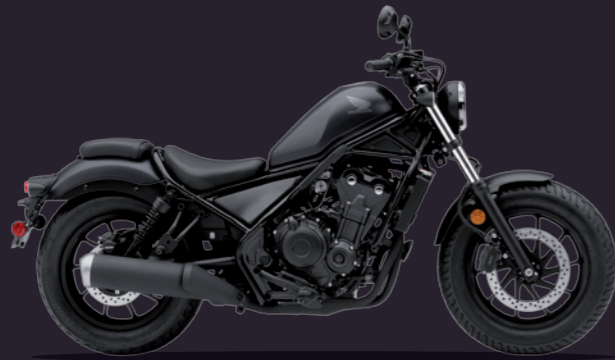
Mat Axis Gray Metallic