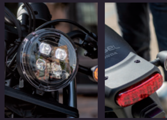
LED 헤드라이트 / 테일라이트