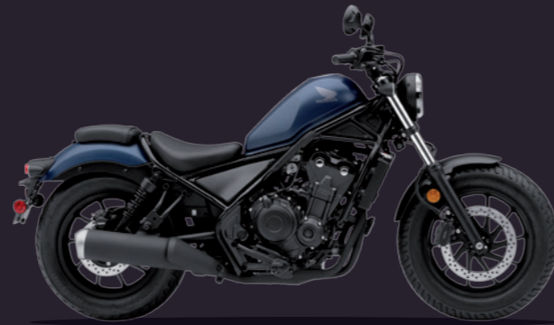
Mat Jeans Blue Metallic